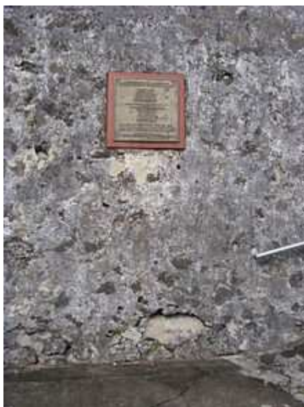
Luogo della fucilazione di Maurice Bishop a Fort Rupert, con i fori dei proiettili ancora visibili

Il colpo di stato aveva insediato al potere una giunta militare guidata dal generale dell'esercito Hudson Austin, con il nuovo M.R.C. (Military Revolution Council) che sostituirà l'ormai disciolto N.J.M. .