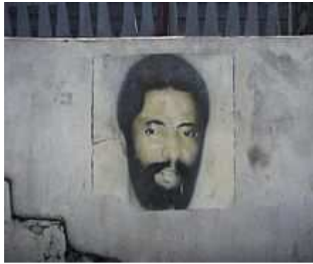
"Murales" raffigurante Maurice Bishop sull'isola di Grenada - 2010

Bishop, a trent'anni dalla morte, è ancora molto amato e ricordato dalla popolazione grenadina, infatti numerose sono i riconoscimenti di ammirazione a distanza di anni, come i " murales " sparsi per tutta l'isola che raffigurano il suo volto o scritte che lo inneggiano. In suo onore, l' Aeroporto Internazionale di Pointe Salines di Grenada, fortemente voluto da Bishop, porta oggi il suo nome.